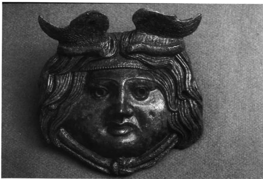
Apliques con máscara de Medusa de Uxama: 1 Pareja.—2 Pieza n.º 1.